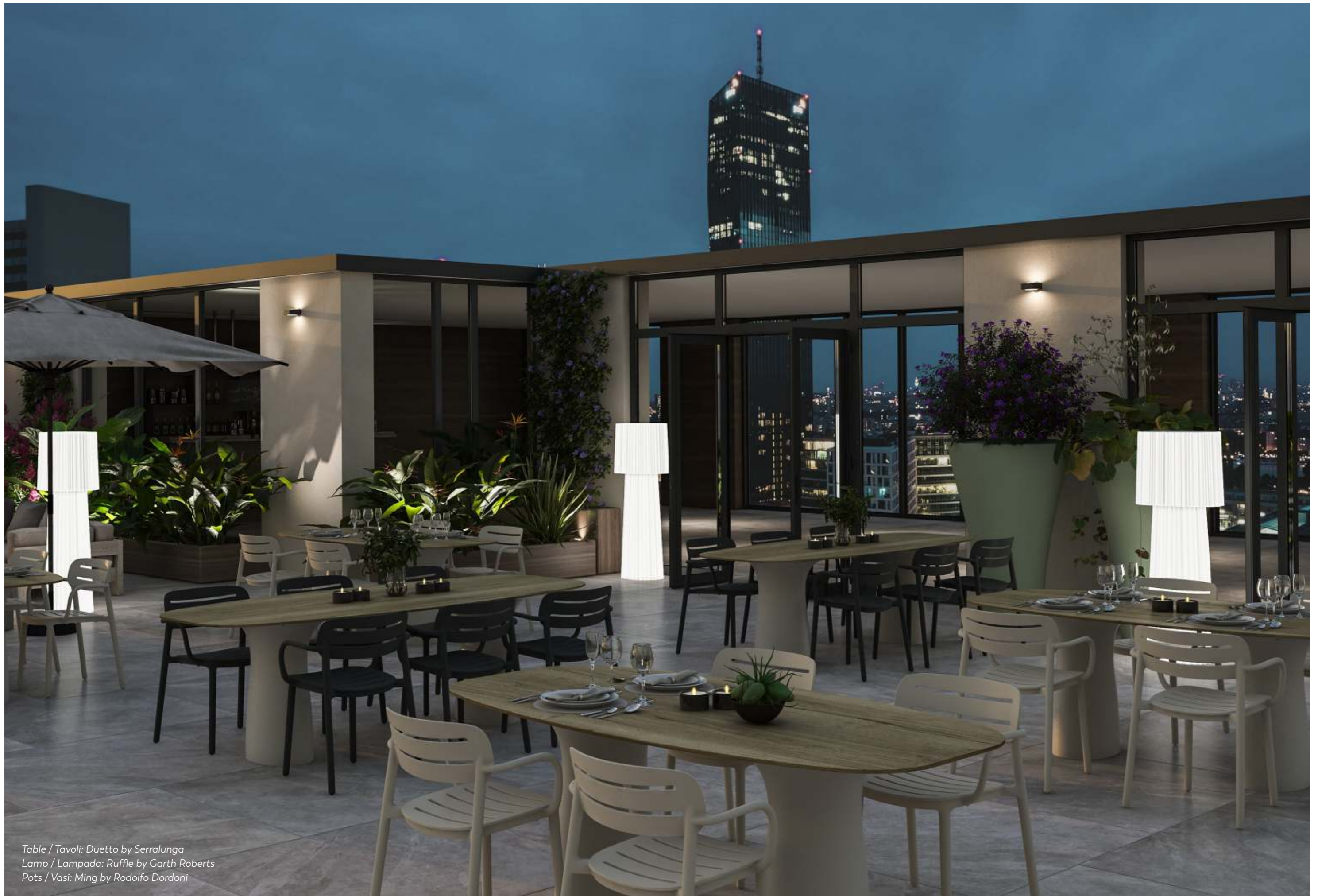
Table / Tavoli: Duetto by Serralunga Lamp / Lampada: Ruffle by Garth Roberts Pots / Vasi: Ming by Rodolfo Dordoni