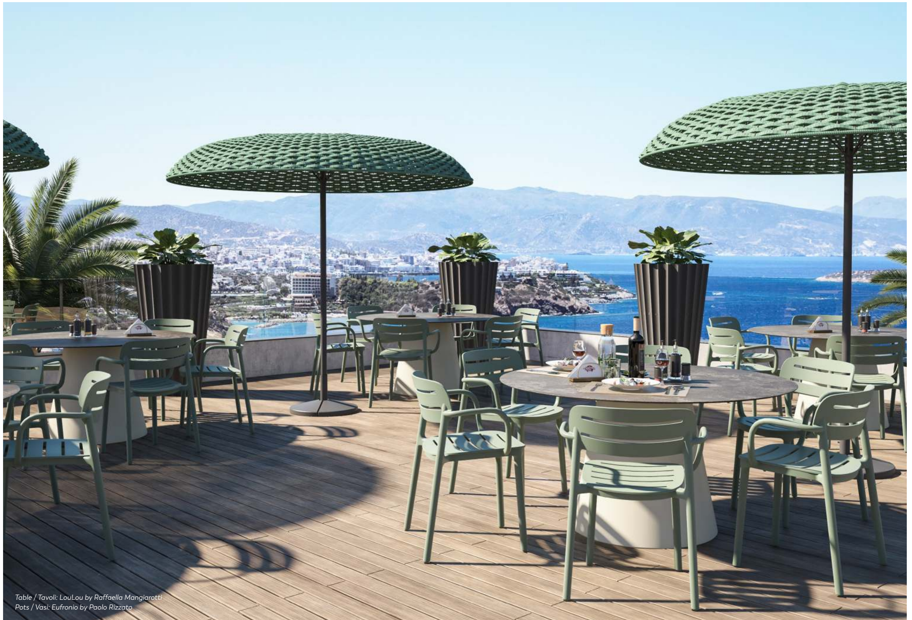
Table / Tavoli: LouLou by Raffaella Mangiarotti Pots / Vasi: Eufonio by Paolo Rizzato