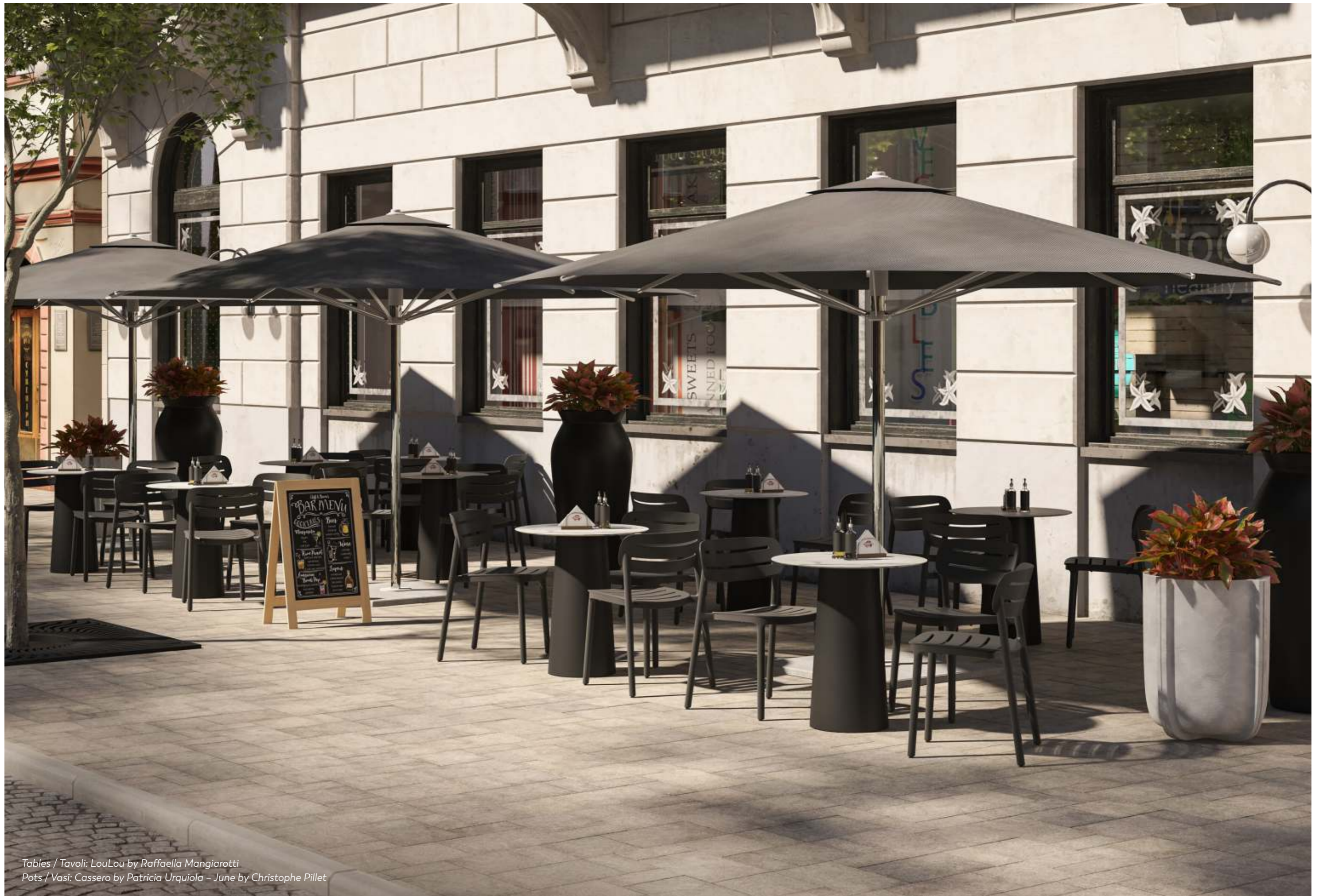
Tables / Tavoli: LouLou by Raffaella Mangiarotti Pots / Vasi: Cassero by Patricia Urquiola - June by Christophe Pillet